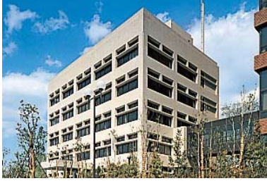
名古屋弁護士会館 1978年