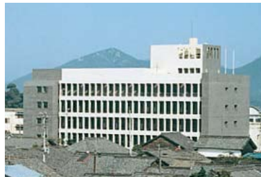
犬山市福祉会館 1970年