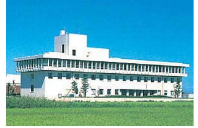
愛知県津島勤労福祉会館 1977年