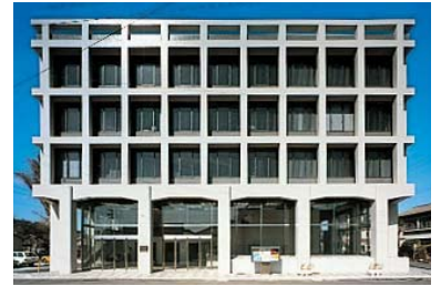
伊勢商工会議所 1972年