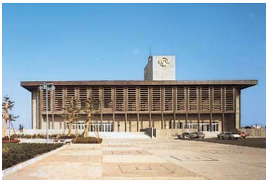
小牧市市民会館・公民館 1972年